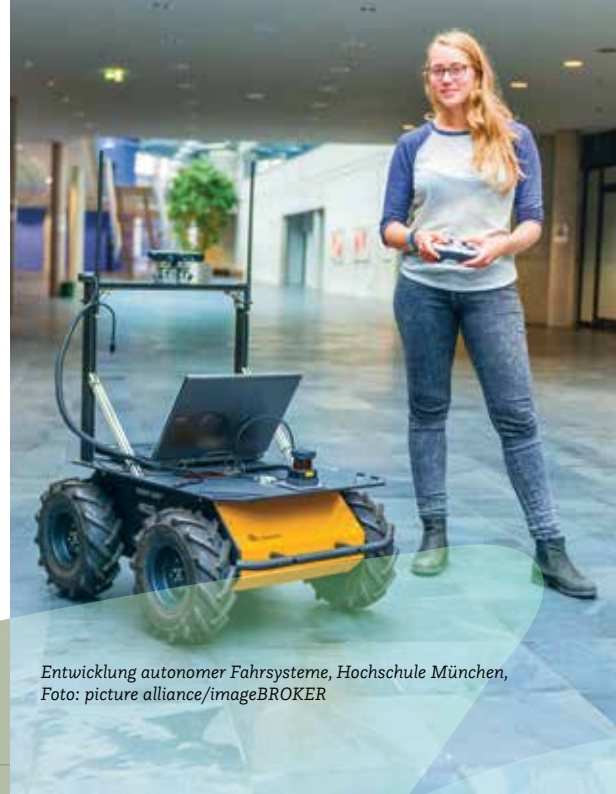
Entwicklung autonomer Fahrsysteme, Hochschule München

Seit 2018 haben Angestellte in größeren Betrieben das Recht zu erfahren, wer wie viel verdient. Das Entgelttransparenzgesetz macht es möglich. Doch um verdeckter Diskriminierung entge-