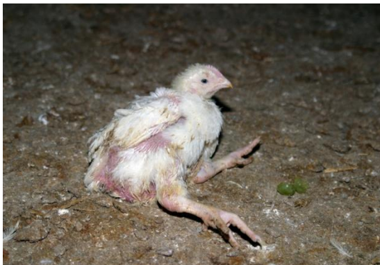
Abb. 4: Masthuhn mit Beinschäden

Darüber hinaus sind Verhaltensprobleme häufig 44 . Die schnell wachsenden Hähnchen nutzen erhöht angebrachte Sitzstangen sowie Ausläufe kaum. Mit Ausnahme der Nahrungsaufnahme nehmen alle Verhaltensweisen im Verlauf der Mast rapide ab, analog steigt der Anteil des Ruhens auf über zwei Drittel der Tageszeit 45 . Darüber hinaus ist die Fortbewegung oft beeinträchtigt. Das lange Liegen auf der feuchten, Ammoniakhaltigen Einstreu begünstigt die Entstehung von Hautveränderungen (z.B. Brustblasen). Die genannten Tierschutzprobleme steigen linear mit der Wachstumsintensität verschiedener Herkünfte an 46 . Ganz ähnliche Probleme bestehen bei den Mastputen, welche auch auf die gleichen Ursachen zurückgeführt werden können. Aufgrund des enormen Wachstumspotentials müssen Mastelterntiere restriktiv gefüttert werden; anderenfalls würden sie viel zu groß, worunter die Fruchtbarkeit stark leiden würde. Da die Tiere in der Folge hungrig sind, kommt es zu verschiedenen Verhaltensstörungen der Nahrungsaufnahme. Putenhennen werden heute ausschließlich künstlich besamt (in den Zuchtbetrieben), um ein Verletzen der Putenhennen durch die viel schwereren Hähne zu verhindern.