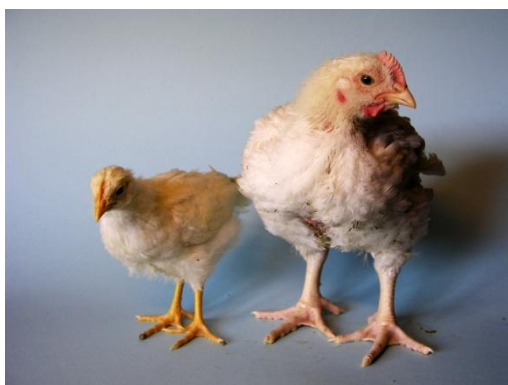
Abb. 3: Größenvergleich zwischen Junghenne (links) und Masthuhn mit 29 Tagen

Die Tierverluste während der Mast in der Praxis liegen bei Masthühnern bei ca. 5 – 7 %, bei Putenhennen bei ca. 4 % und bei Putenhähnen sogar bei 11 % 39 . Zu den Leistungsbedingten Gesundheitsproblemen gehören vor allem Herz-Kreislaufkrankungen (z.B. plötzlicher Herztod und Bauchwassersucht bei Masthühnern, Aortaruptur bei Puten), Erkrankungen des Skelettsystems (z.B. die Gelenkerkrankung tibiale Dyschondroplasia, TD), sowie Muskelerkrankungen (Myopathie der tiefen Brustmuskulatur) 40 . Skelett und innere Organe können mit dem rasanten Muskelwachstum nicht Schritt halten. Die Zucht auf übergroße Brustmuskeln hat zu einer Verlagerung des Körperschwerpunktes bei Puten und Hähnchen geführt, wodurch diese unsicher laufen. Verschiedene Praxisstudien zeigten Häufigkeiten der TD bei Masthühnern von 55 bis zu 90 % 41 und akuter Lahmheiten zwischen 2 und 33 % der Tiere 42 . Die Beinschäden (vgl. Abb. 4) sind oft schmerzhaft, so ergaben Versuche, dass sich Masthühner oder Mastputen mit Zugang zu Schmerzmitteln mehr und schneller fortbewegten 43 . Ein großes Tierschutzproblem in der Intensivmast von Hähnchen oder Puten sind auch schmerzhaft entzündungen an den Fußballen.