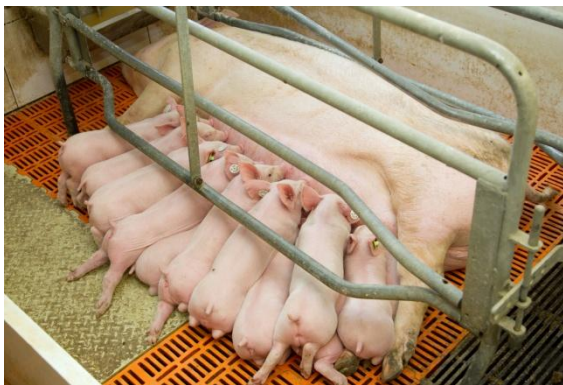
Abb. 2: Sau mit großem Wurf

Die Anzahl abgesetzter Ferkel pro Sau und Jahr ist ein wirtschaftlich sehr wichtiger Parameter für den Tierhalter. Er konnte kontinuierlich gesteigert werden, zunächst durch eine Verkürzung der Säugedauer, später durch eine züchterische Steigerung der Wurfgrößen. 2011 wurden im Mittel 26,6 Ferkel je Sau und Jahr abgesetzt bei 2,34 Würfen im Jahr 28 . Die Ferkel werden heute im Durchschnitt nur noch 3 – 4 Wochen gesäugt, so dass die Sauen mehr als zweimal im Jahr werfen. Die kurze Säugezeit belastet die Tiere, da weniger Zeit für die Rückbildung der Gebärmutter besteht, was Fruchtbarkeitsstörungen begünstigt. Ferner sind die früh abgesetzten, leichten Ferkel anfälliger. In den letzten Jahren wurden die Wurfgrößen züchterisch stark gesteigert (s. Abb. 2), z.B. durch die Verwendung von Hybridsauen aus Dänemark, den Niederlanden oder Frankreich. Die Sauen werfen heute oft schon mehr Ferkel, als sie Zitzen haben (durchschnittlich nur 7 Zitzenpaare vorhanden), so dass überzählige Ferkel aufwändig künstlich aufgezogen werden müssen. Ferner nimmt aufgrund der begrenzten Gebärmutterkapazität das Geburtsgewicht des einzelnen Ferkels mit zunehmender Wurfgröße ab, wodurch die Ferkelverluste ansteigen (Unterkühlung, Erdrücken) 29 .